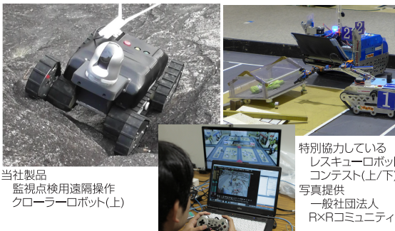
当社製品 監視点検用遠隔操作 クローラーロボット(上)