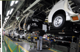
組立工場

高い信頼性を要求される産業用コンピュータハードウェア技術と豊富な実績に裏付けされたシステム化技術により、生産現場や社会インフラの現場などの「現場」の課題を解決する「高信頼システム」を提供しています。